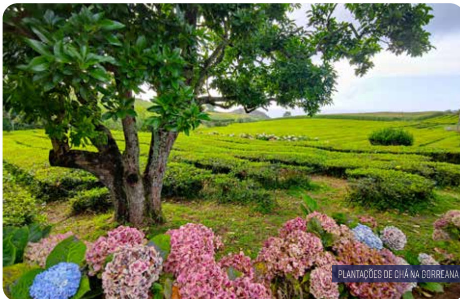
PLANTAÇÕES DE CHÁ NA GORREANA